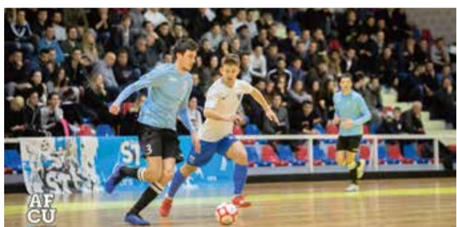
Za studente je ulaz besplatan na sve domaće utakmice

Osim što su na sredini prvoligaške tablice, ono što jedan klub kao što je AFCU uopće svrstava u vijest jest njegov drukčiji pristup sportu, koji je – kako sami kažu – ‘bez rezultatskog imperativa te uz dugoročnu orijentiranost na izgradnju dualnih karijera, odnosno spoja sporta i obrazovanja’