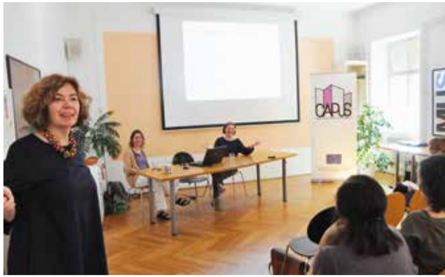
Predavanje u Muzejskom dokumentacijskom centru u Zagrebu

Nepotpune i nepravovremene prijave neće se razmatrati. Na natječaj se, pod jednakim uvjetima, mogu prijaviti osobe oba spola.