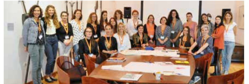
Sudionici teorijsko-praktičnih radionica

GOSTOVANJE BRITANSKIH MUZEJSKIH EDUKATORICA