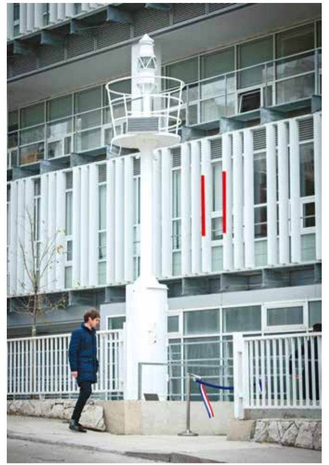
Lanterna Svjetlo Kampusa