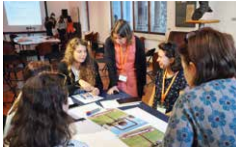
Jedna od radionica u Muzeju grada Splita