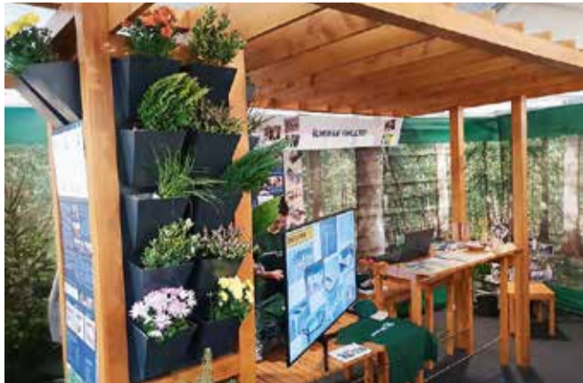
Štand Šumarskog fakulteta proglašen je najboljim na Smotri sveučilišta 2018.

Za najbolje uređen izložbeni prostor priznanje je dobio Šumarski fakultet Sveučilišta u Zagrebu. Priznanje za najbolje predstavljanje na pozornici dodijeljeno je Učiteljskom fakultetu Sveučilišta u Zagrebu, dok su priznanje za komunikativnost i susretljivost osvojili Medicinski fakultet i Geotehnički fakultet Sveučilišta u Zagrebu te Visoka škola Aspira iz Splita. Najoriginalnije predstavljanje na Smotri ostvarili su