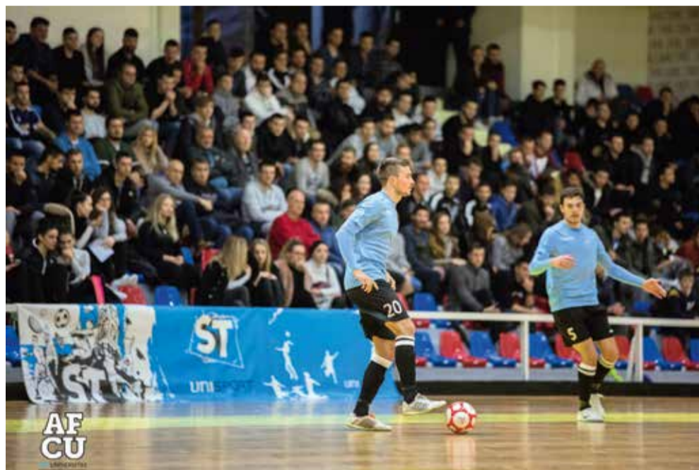
Posjećenost na tribinama domaćih utakmica AFCU-a redovito je velika

– Nakon božićno-novogodišnjeg odmora nastavljamo s treninzima i pripremama s