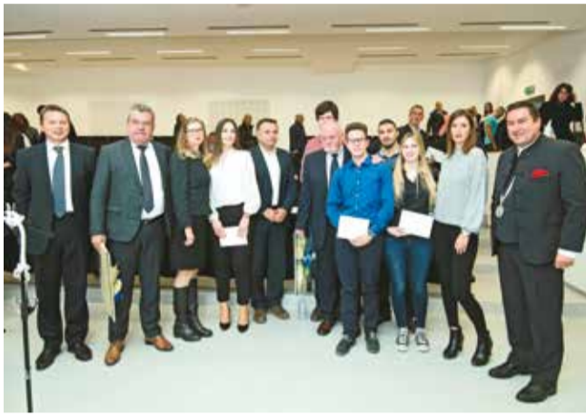
Nagrađeni studenti sa sponzorima nagrada i dekanom