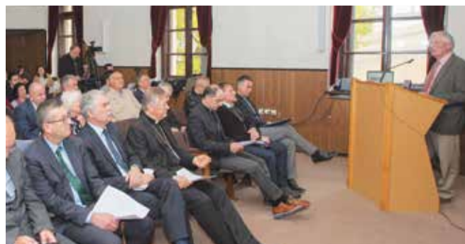
Otvorenje Centra don Frane Bulić na splitskom KBF-u

Svoju svrhu Centar postiže kroz nekoliko vrsta djelatnosti: individualni i grupni istraživački rad u domaćim i stranim arhivima, muzejima i knjižnicama; obrada i objava u izdavačkim nizovima epigrafskih i diplomatskih izvora nastalih u papirskoj kancelariji, te drugih izvora, osobito onih iz otomanske vladavine koji su od izuzetne važnosti za crkvenu povijest i teologiju južne Hrvatske; interdisciplinarni istraživački rad na srednjovjekovnoj rukopisnoj baštini (kodeksima) južne Hrvatske u domaćim i stranim arhivima i knjižnicama; objava tiskanih i elektroničkih izdanja Centra povijesne i teološke tematike, važnih za povijest Katoličke crkve u južnoj Hrvatskoj; snimanje dokumentarnih filmova povijesne i teološke tematike; organiziranje domaćih i međunarodnih seminara, ljetnih i zimskih škola te znanstvenih i stručnih skupova; suradnja s domaćim i međunarodnim visokoškolskim i istraživačkim institucijama i centrima, međunarodna razmjena istraživača, nastavnika i studenata te poticanje suradnje s gospodarstvenim sektorom.