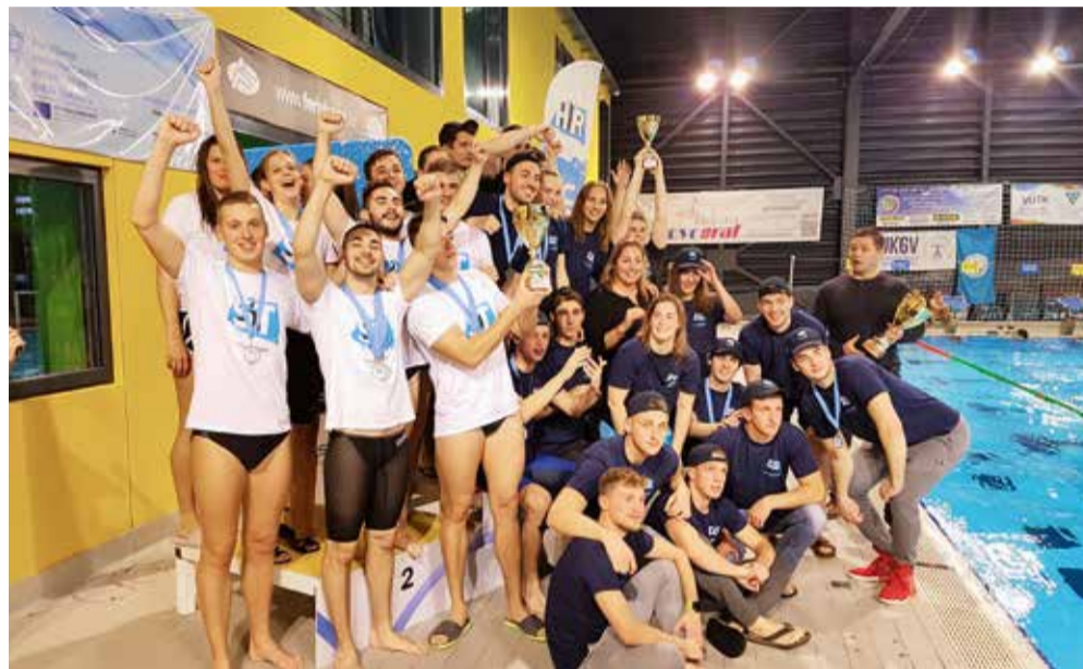
Svi osvajači plivačkih medalja

Inače, natjecanja su se odvijala u disciplinama prsno (50m, 100m), leđno (50m, 100m), leptir (50m, 100m), slobodno (50m, 100m, štafeta 4x50m) te mješovito (štafeta 4x50m), a sudjelovale su reprezentacije sveučilišta iz Splita, Zadra, Osijeka i Zagreba, Sve-